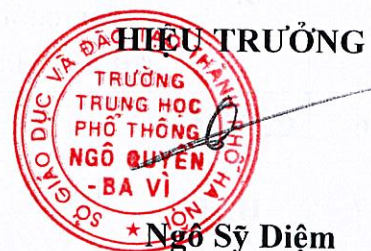
Ngô Sỹ Diệm